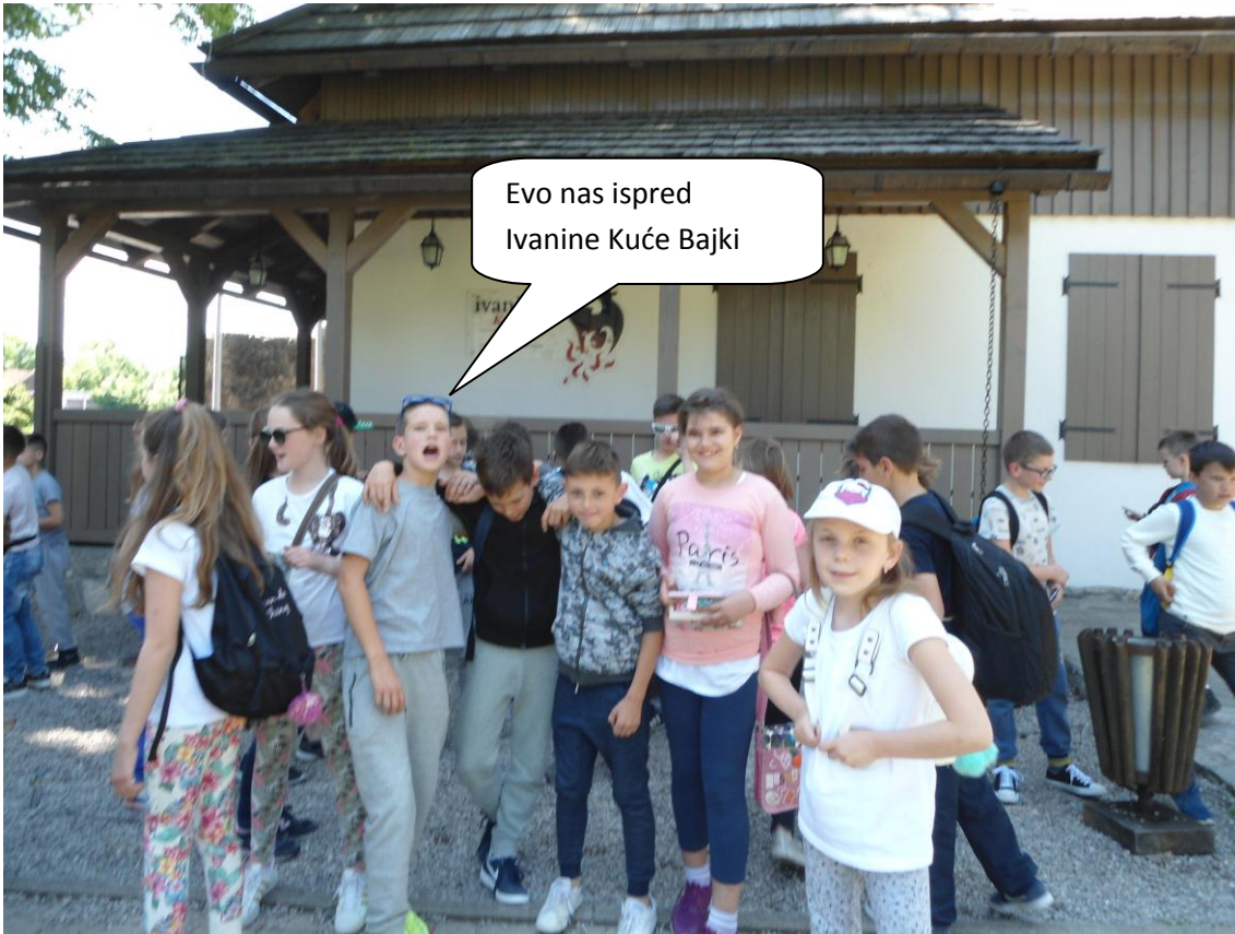
Evo nas ispred Ivanine Kuće Bajki